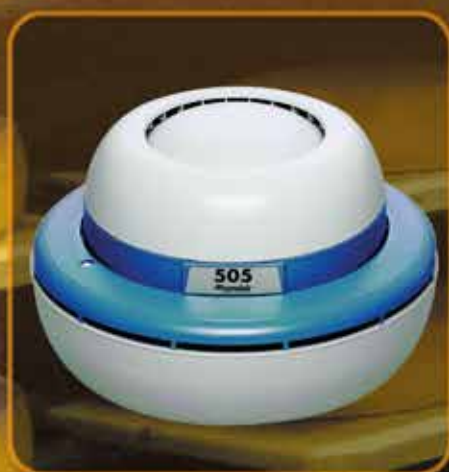
Condair 505 – l'universel