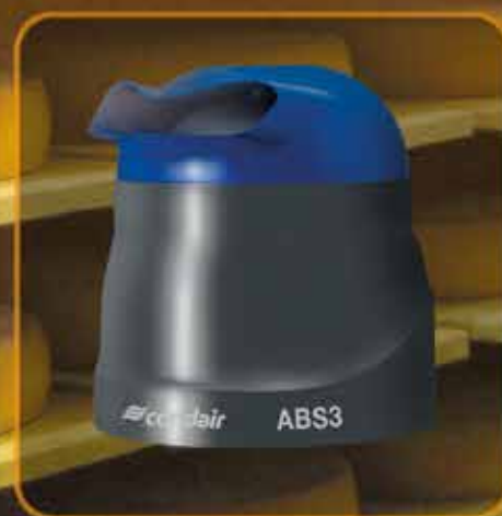
Condair ABS3: un appareil puissant et polyvalent

Horizontal ou vertical ? Les diffuseurs de cet atomiseur compact dispersent le fin brouillard d'aérosol sans gouttes dans la direction choisie. L'appareil se nettoie en un tour de main. C'est vous qui décidez si vous souhaitez raccorder votre Condair 505 au réseau d'eau ou remplir le réservoir d'eau manuellement.