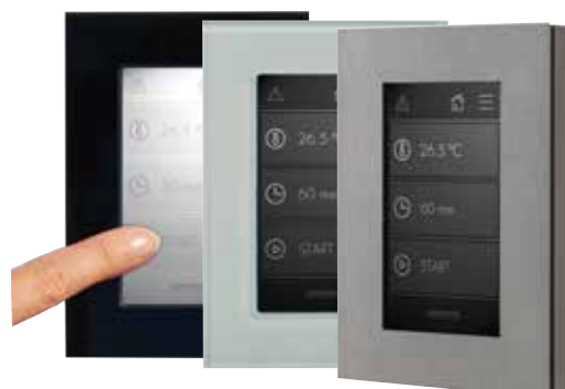
Écran tactile externe en trois versions

Le cadre est fixé sur l'écran grâce à des aimants ce qui permet aisément d'adapter la couleur du cadre choisi.