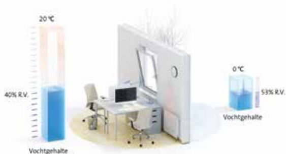
Met luchtbevochtiging in de ruimte

Als u hoge eisen stelt aan comfort maar ook aan design, gebruiksgemak en hygiëne is er nu het luchtbevochtigingssysteem Condair HumiLife - De flexibele ruimte oplossing speciaal ontwikkeld voor luxe gebouwen. Het gepatenteerde vernevelingssysteem zorgt ervoor dat iedere ruimte, voorzien van een eigen vernevelaar, individueel kan worden ingesteld en geregeld. De bevochtigungsunits met de kleinst mogelijke afmetingen maken het mogelijk dat het systeem eenvoudig en nauwelijks zichtbaar in plafonds en wanden kan worden geïntegreerd. De Condair HumiLife is stil, energiezuinig, onderhoudsarm en kan eenvoudig worden bediend via de wandmodule en/of via een app op de telefoon en/of tablet (KNX)