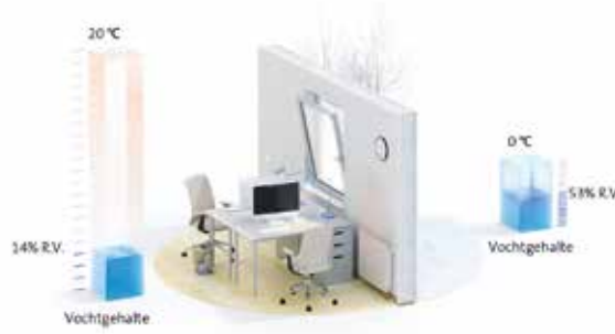
Zonder luchtbevochtiging in de ruimte