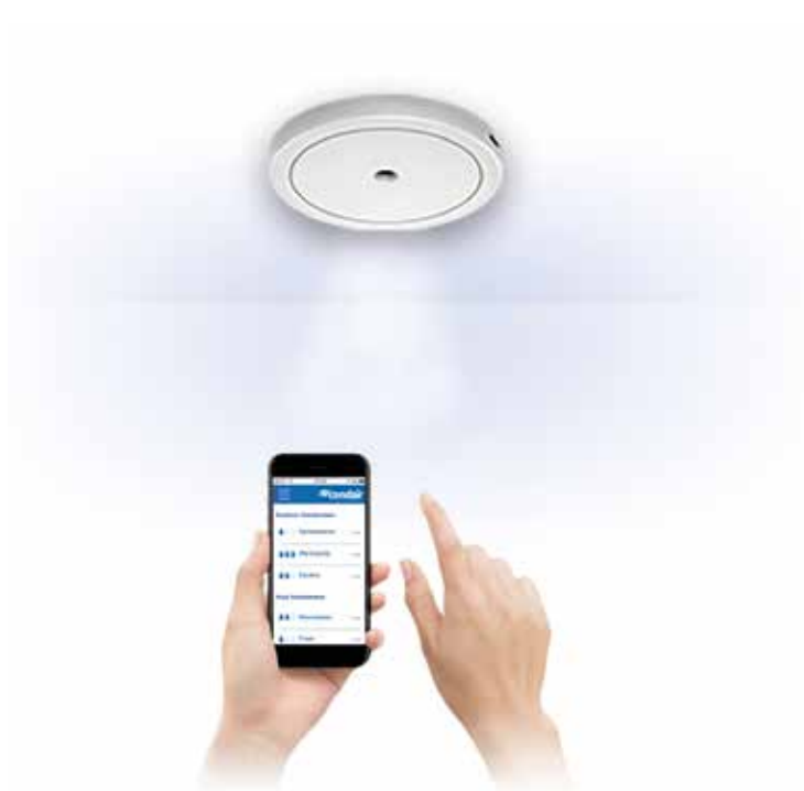
Bediening op afstand via app

Met de Condair HumiLife vloeien design en functionaliteit naadloos in elkaar over. Met dit volledig geïntegreerde en altijd direct beschikbare luchtbevochtigingssysteem wordt een optimaal klimaat voor u gecreëerd. Hierdoor bent u niet alleen beter beschermd tegen virussen, bacteriën en allergieën, maar zult u zich ook aanzienlijk comfortabeler voelen en beter slapen. Bovendien worden zo de meubels, kunstwerken, muziekinstrumenten en/of uw parketvloer in optimale conditie gehouden.