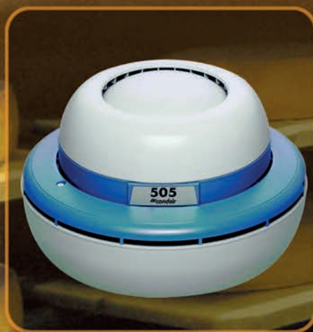
Condair 505: Eenvoudig universeel