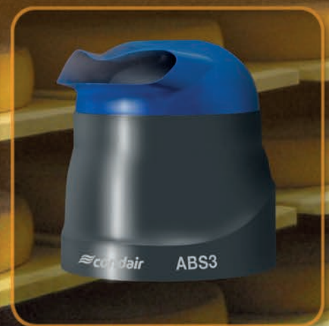
Condair ABS3: Dubbele kracht

Horizontaal of verticaal? De verspreidingskappen, die met deze compacte vernevelaar worden meegeleverd, maken individueel richten van de fijne nevel mogelijk, absoluut vrij van druppels. De unit kan gemakkelijk worden gereinigd en u kunt zelf bepalen of u de Condair 505 op de waterleiding wilt aansluiten. U kunt ook gebruik maken van het handmatig te vullen waterreservoir.