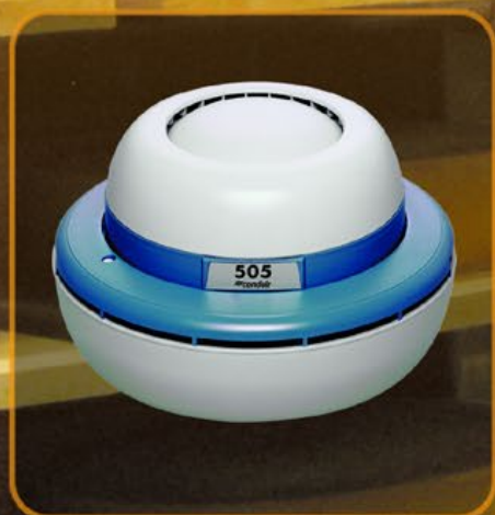
Condair 505 – l'universel