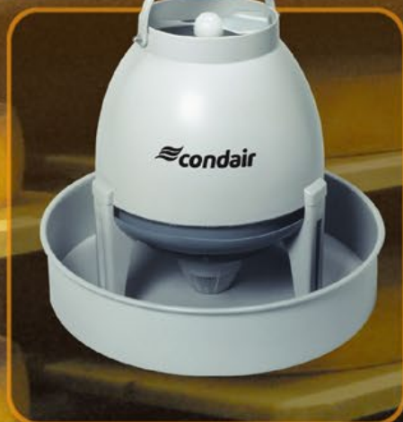
Condair 3001 – le plus sûr