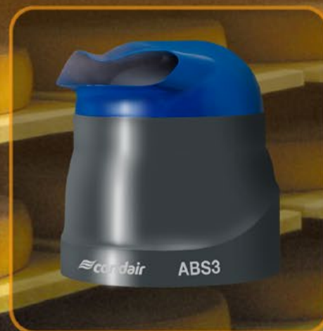
Condair ABS3: un appareil puissant et polyvalent

Horizontal ou vertical ? Les diffuseurs de cet atomiseur compact dispersent le fin brouillard d'aérosol sans gouttes dans la direction choisie. L'appareil se nettoie en un tour de main. C'est vous qui décidez si vous souhaitez raccorder votre Condair 505 au réseau d'eau ou remplir le réservoir d'eau manuellement.