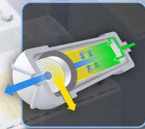
Traitement de l'eau intégré

Le Condair HP fournit de l'eau déminéralisée à 70 bar de pression aux buses de nébulisation installées à l'intérieur d'une conduite d'air. Les buses de nébulisation sophistiquées génèrent une brume extrêmement fine rapidement absorbée dans le flux d'air, tandis qu'un séparateur de gouttelettes à haute efficacité contient toute l'eau excédentaire dans la section. Un air d'humidification frais est alors libéré dans les pièces, ce qui crée un environnement sain et améliore la productivité.