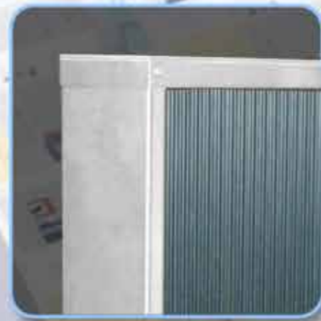
Air d'humidificateur – exempt d'aérosols