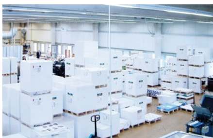
Konstante Produktionsbedingungen durch konstante Luftfeuchtigkeit

System erhalten wir einen guten Service, eine schnelle Abwicklung und man bekommt immer direkt eine Rückmeldung. Die Anlage macht, was sie soll: sie läuft. Und wir können uns auf unser Kerngeschäft konzentrieren“, so Andreas Wilke.